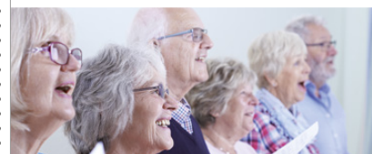
Freizeitgruppen & Veranstaltungen