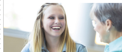
soziale Beratung & Unterstützung

Wir engagieren uns für gemeinnützige Zwecke und setzen uns für ein soziales Miteinander ein. Unsere Mitglieder, Ehrenamtliche wie Freiwillige, helfen, wo Hilfe gebraucht wird.