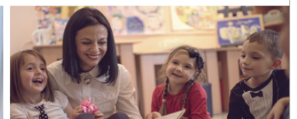
Aktionen & Initiativen im Kiez

Als Mitglied können Sie sich in Ihrem eigenen Kiez oder berlinweit engagieren oder von den zahlreichen Freizeit- und Beratungsangeboten profitieren.