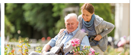
Ausflüge & Mehrtagesfahrten